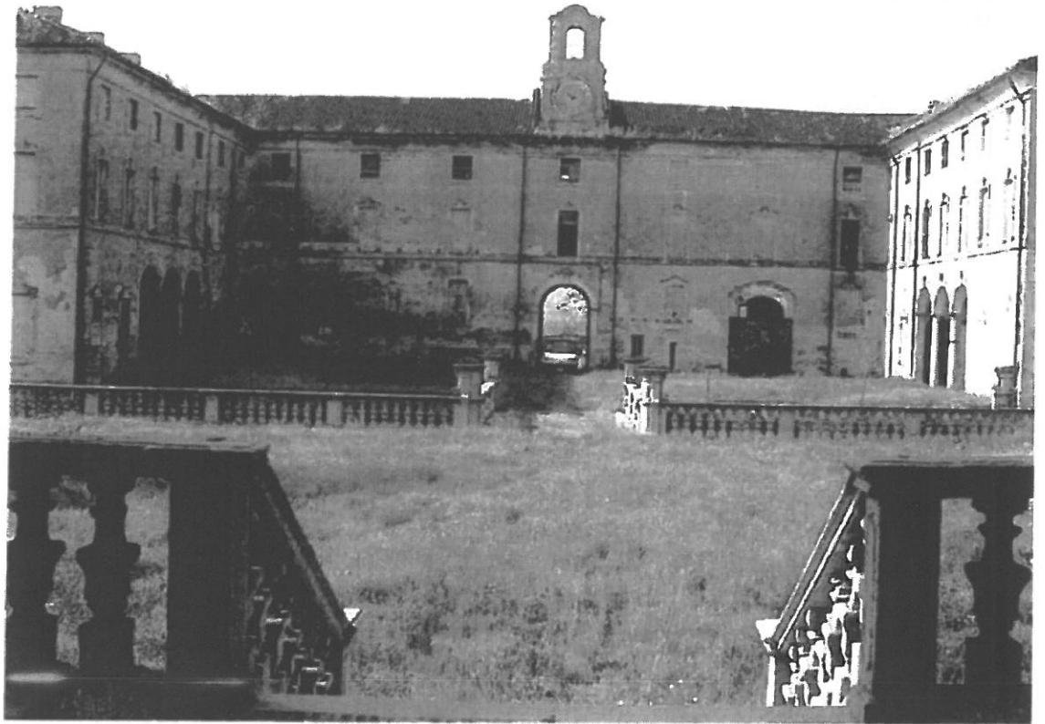
Immagine corte interna

Ad oggi, nelle scuderie, sono in corso di realizzazione i lavori previsti in un primo stralcio funzionale, nell'ambito dell'accordo del Programma Quadro in materia di Beni ed Attività culturali promosso dal comitato paritetico di attuazione composto dal Ministero BBAACC, la Regione Emilia Romagna ed il Comune di Busseto; i lavori consistono in restauri e consolidamenti strutturali di copertura e sottostante struttura lignea, trattamenti a contrasto dell'umidità presenti nelle murature e pavimentazioni, consolidamento di solai lignei ed a volta, restauro degli intonaci interni e di facciata, sostituzione della serramentistica lignea, inserimento di impiantistica termica e di trattamento aria oltre alla nuova impiantistica elettrica, restauro delle pavimentazioni in cotto e tinteggiature a calce.