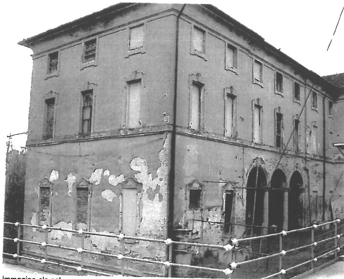
Immagine ala est

Il presente secondo stralcio funzionale di lavori prevede: