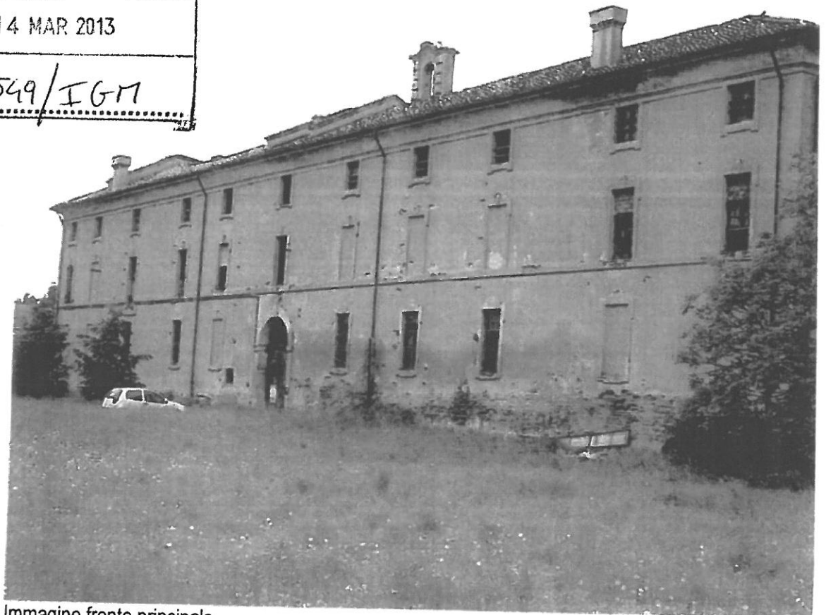
Immagine fronte principale